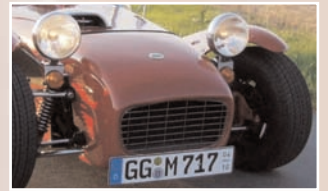
209 Michael Ukelis (D) Ute Ukelis Westfield Super Seven SE, Bj. 1987