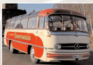
80 Uwe Zimmermann (D) Mercedes O 321H Bj. 1961