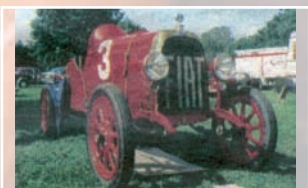
5 Herbert Spross (D) Fiat 501 S Corsa Bj. 1924