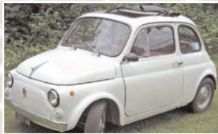
175 Benno Streun (D) Fiat 500, Bj. 1972