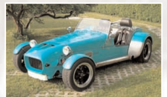
213 Volker Deschner (D) Beate Deschner Rush Motorsport Super Seven, Bj. 1991