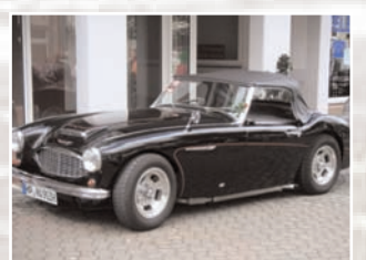
141 Manfred Busalt (D) Gabi Busalt Austin Healey 100/6 BN6 Bj. 1957