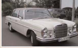
170 Gerhard Bonn (D) Bärbel Bonn Mercedes W 108 Bj. 1971