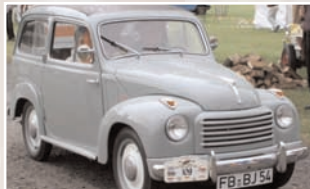
100 Heinrich Sauer (D) Hannelore Sauer NSU-Fiat 500 C Belvedere Bj. 1954