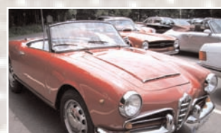
130 Ute Ruchti (D) Alfa Romeo Giulia Spider Bj. 1963