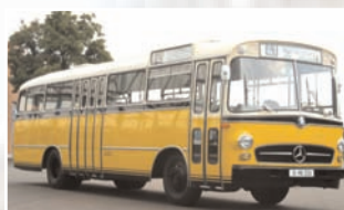
79 Udo Becker (D) Mercedes Benz O 322 Bj. 1961