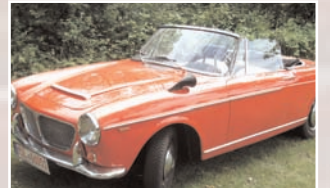
132 Carmello Rinallo (D) Santina Rinallo Fiat 1200 Cabrio, Bj.1962