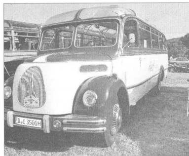
17 Omnibusse, darunter der Magirus 0 3500 von Gerd Adorf, kamen in den Odenwald