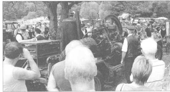
Lanzfreunde Heubach beim Start des HEMAG Stationärmotors