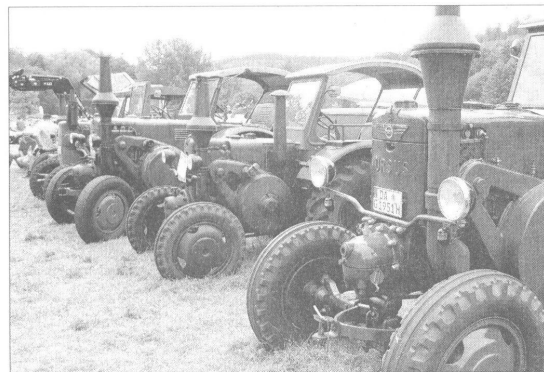
Über 200 Traktoren wurden im Kurpark ausgestellt

Das war schon ein großes Highlight, als Heinrich Ausserer aus St. Felix in Südtirol bereits am Freitagabend mit seinem Fross-Büssing LKW aus dem Baujahr 1910 in Bad König einfuhr. Das 5 Tonnen schwere Koloss mußte eigens mit einem Kranwagen abgeladen werden. Und alle Organisatoren waren vor Ort und hatten ihren Spaß, als der Büssing, gehalten von vier Seilen, auf dem Festivalgelände einschwebte.