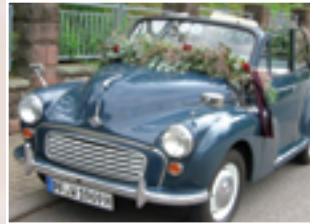
180 Wolfgang Schmidt-Richter (D) Beate Richter Morris Minor 1000 Convertible, Bj. 1969