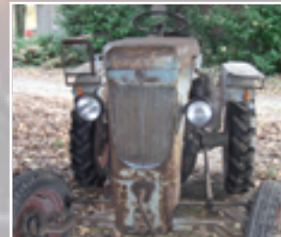
302 Ludger Kobe (D) ENSINGER AS 15, Bj. 1949, 15PS