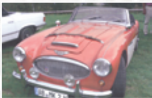
152 Günter Smolny (D) Gunter Demetrio Austin Healey 3000 MK II A BJ 6, Bj.1963