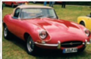
178 Jörg Thuss (D) Jaguar E-Type 1 1/2 Bj. 1968