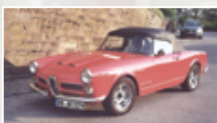
105 Hartmut Rupp (D) Heinrich Himmler Alfa Romeo 2000 Spyder Bj. 1962