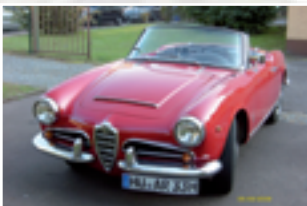
107 Ute Ruchti (D) Alfa Romeo Giulia Spider Bj. 1963