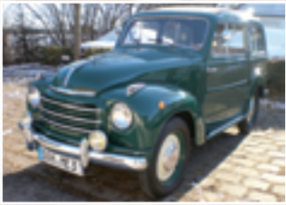
47 Manfred Eidinger (D) FIAT 500 C Belvedere, Bj. 1954